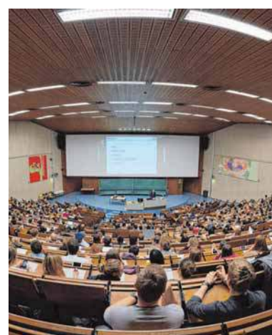
Welcher Studiengang passt zu mir – solche Fragen werden beantwortet.

Anmeldungen sind ab sofort möglich und zwar online unter www.bw-best.de . Die Seminare dauern jeweils von 8 bis 17 Uhr. Die Teilnahmegebühr beträgt zehn Euro.