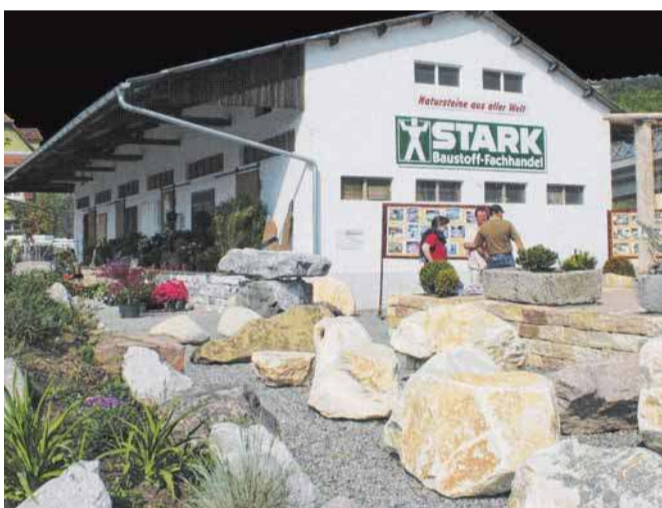
Sehr zum Wohle: Im alten Bahnschuppen findet eine rustikale Weinprobe statt.

IMMENDINGEN - Neben Garten- und Landschaftsbauern sind auch Gärtnereibetriebe unter den Ausstellern. Außerdem sind Hersteller von Betonwaren, Teich- und Pumpentechnik, Regenwassernutzung sowie von chemischen Baustoffen vertreten. Als robuste und pflegeleichte Alternative zu Naturstein und Beton werden keramische Feinsteinzeug-Bodenplatten für die Anwendung auf der Terrasse bzw. im Außenbereich präsentiert. Auf dem Stand eines auch auf den Poolbau spezialisierten Garten- und Landschaftsbauers wird am Sonntag ein intelligenter Reinigungsroboter zur Reinigung von Pools und Wasserbecken vorgestellt.