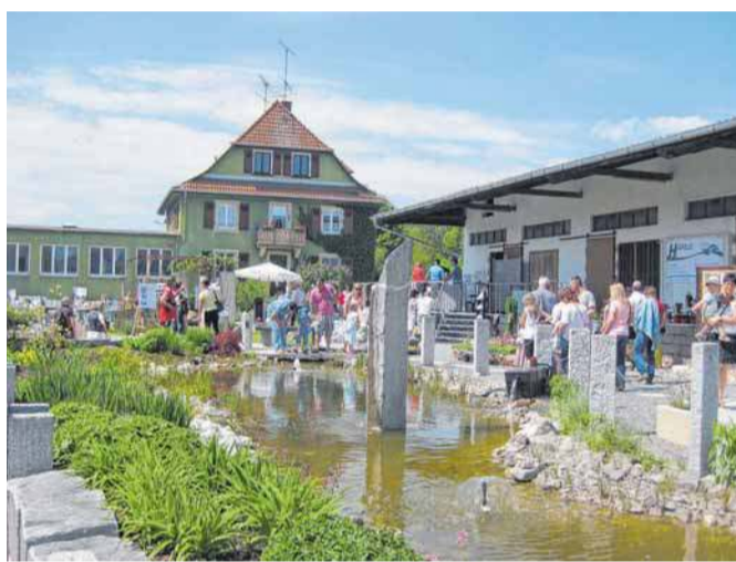
Die Immendinger Gartentage geben viele Anregungen zur Gartengestaltung und laden zum Flanieren ein.

Am Samstag und Sonntag, 22. und 23. April 2017, finden die dreizehnten „Immendinger Garten-Tage“ auf dem Betriebsgelände der Firma „Stark“ statt. Über 20 Aussteller aus der Garten- und Landschaftsbaubranche informieren über die Neuigkeiten und Möglichkeiten für Ihr Wohnumfeld im Freien.